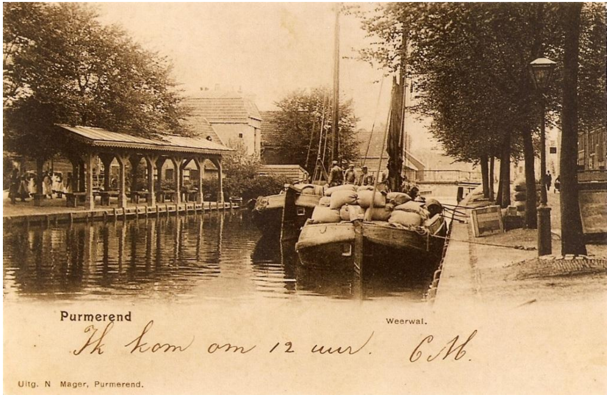
Wheerwal met vismarkt omstreeks 1920

Vis werd van oudsher verhandeld op wat nu nog steeds de Vismarkt is, aan het einde van de Peperstraat, daar waar die op De Where uit kwam.