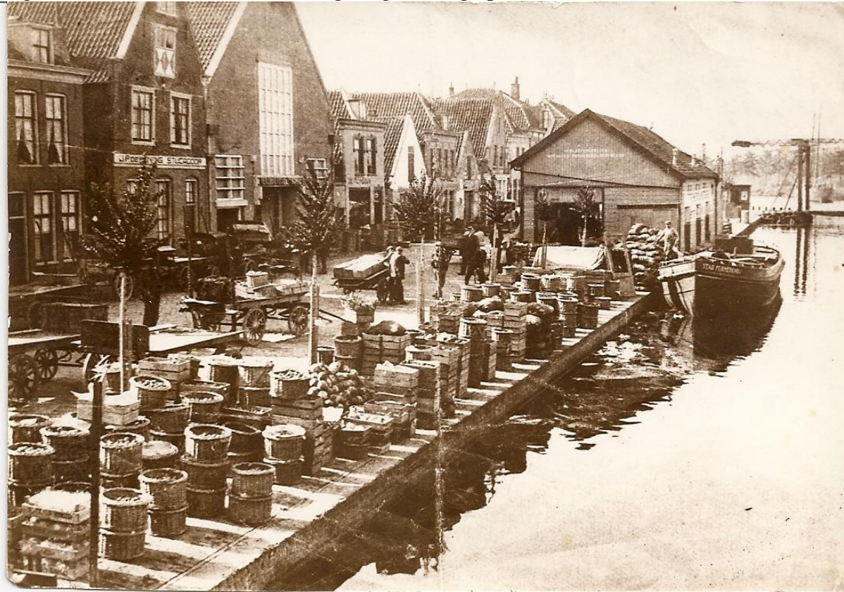
Groenteveiling Venediën omstreeks 1936

te voet naar Purmerend. Maandagnacht vertrekken, via Oosthuizen, dan de dijk langs de ringvaart van de Beemster om dinsdagmorgen vroeg op de markt te komen.