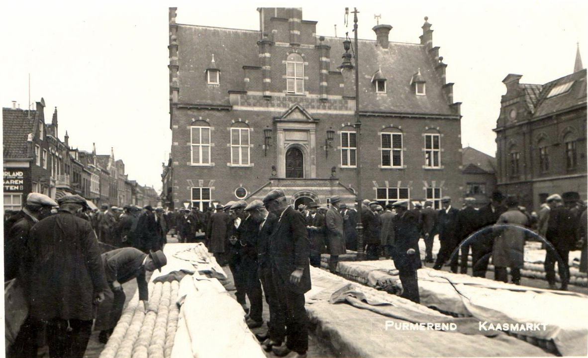
De Kaasmarkt 1930